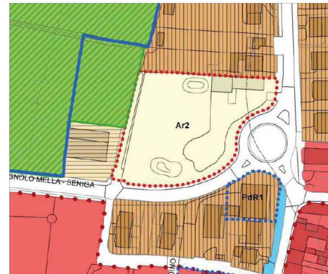
Legenda Confine Comunale corpi idrici viabilità di progetto fasce di rispetto stradale Ambito di Trasformazione del Documento di Piano ambito di trasformazione commerciale ambito di trasformazione produttivo ambito di trasformazione residenziale