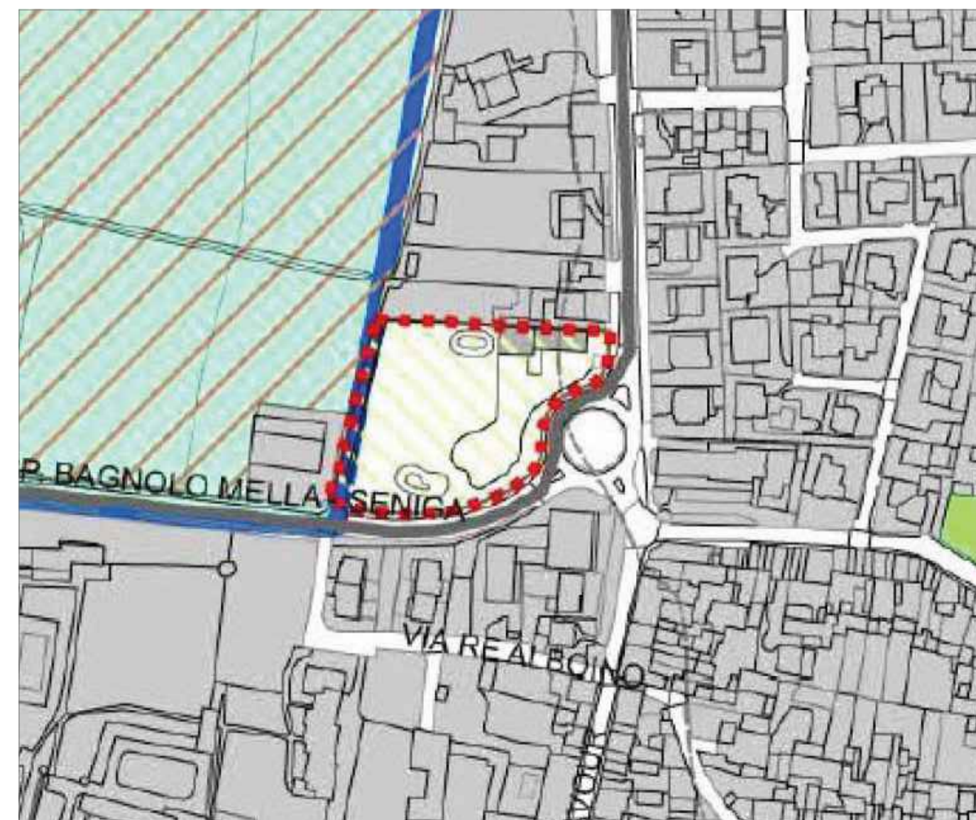
Elementi di criticità ambiti produttivi esistenti altri ambiti edificati/edificabili Ambiti di Trasformazione ambito di trasformazione commerciale ambito di trasformazione produttivo e commerciale ambito di trasformazione residenziale viabilità esistente viabilità di progetto