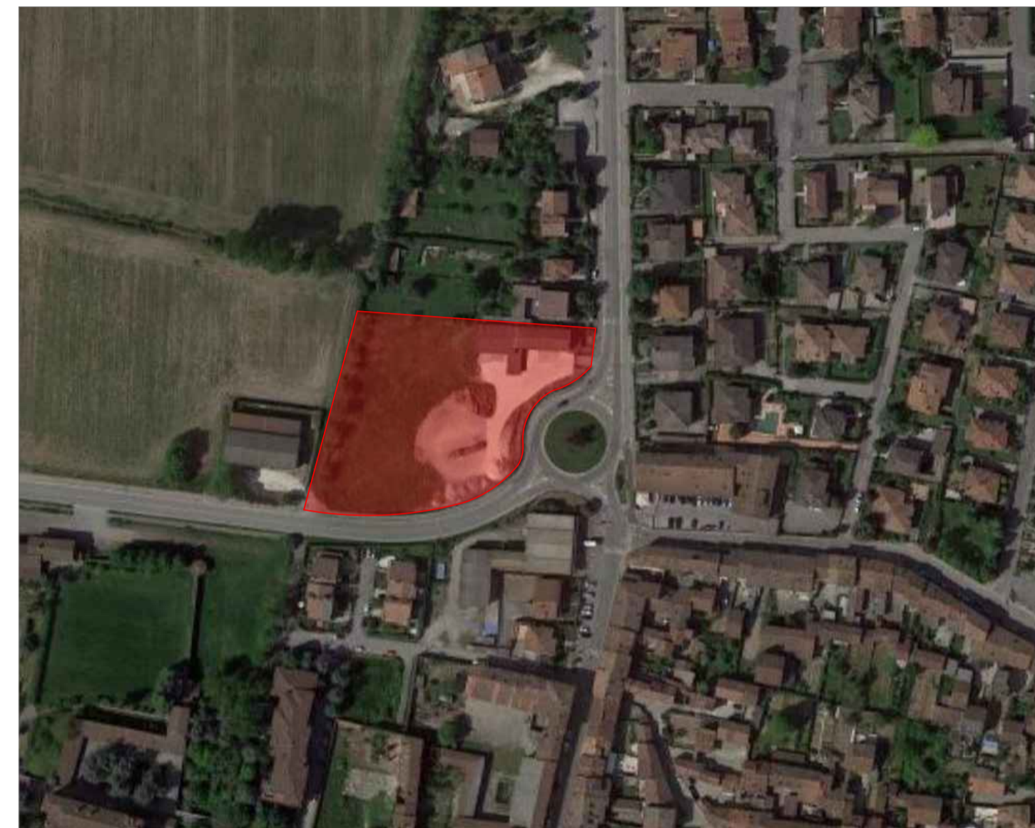
Legenda Area Oggetto d'intervento